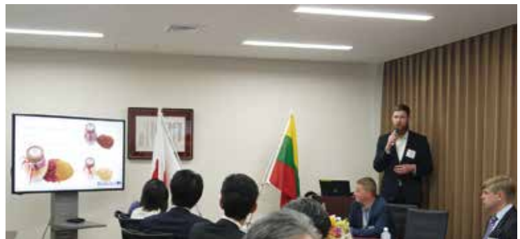
ヴィリニウスの企業8社がプレゼンテーションを行いました。