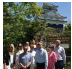
金華山・岐阜城にて