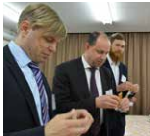
リトアニア産はちみつとベリーを使用した鮎菓子好評でした。