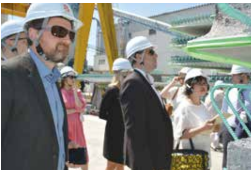
岐阜の企業を視察する一行